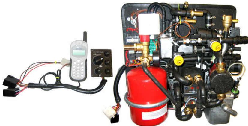
MPC med tillhörande kontrollpanel inkl telefonstyrning

Bil & Marintrims MPC är en prefabricerad värmeanläggning med "plug & play"-funktionalitet som gör det snabbt och enkelt att installera vattenburen värme i husbilar & båtar (>30-60 fot). Anläggningen är baserad på EBERSPÄCHER eller WEBASTO dieselvärmare (3-10kWh) och ger överlägsen komfort och funktionalitet.